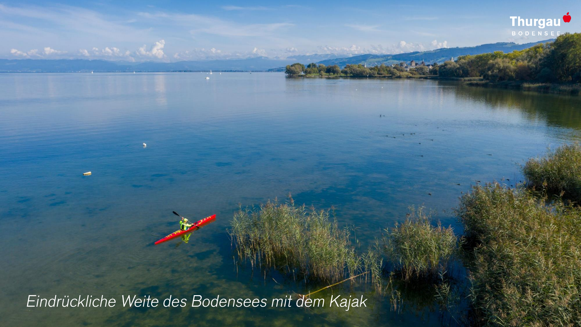
Eindrückliche Weite des Bodensees mit dem Kajak