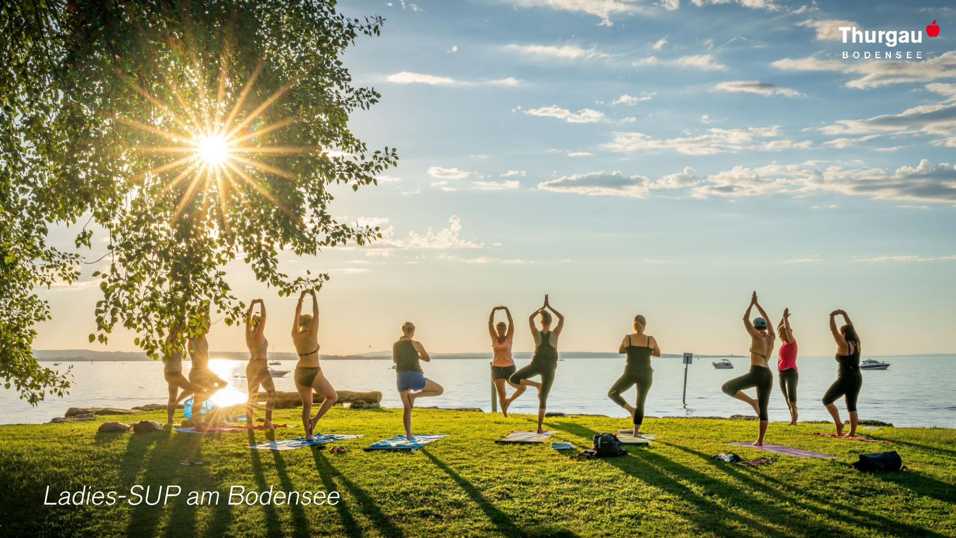
Ladies-SUP am Bodensee