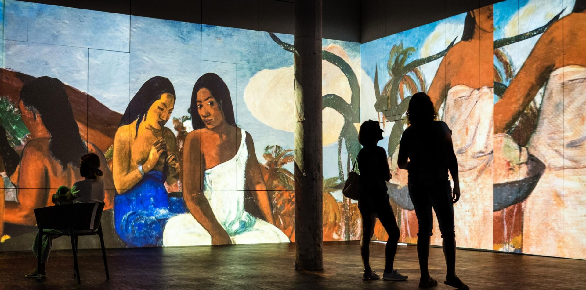
House of Digital Art, Romanshorn