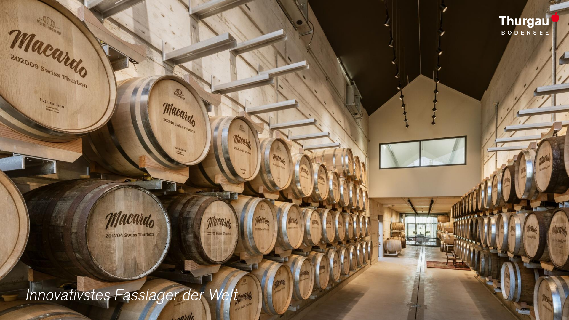
Innovativstes Fasslager der Welt